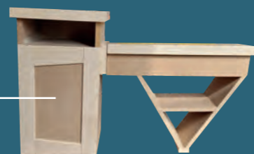
Meuble réalisé par Yoan

Dans la menuiserie, tout comme dans d'autres métiers du second œuvre, le geste artisanal d'autrefois s'enrichit de la technicité d'aujourd'hui pour créer et innover.