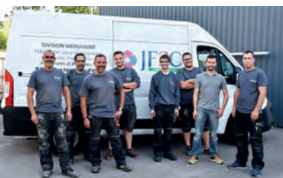
Division Menuiserie intérieure et extérieure

La fabrication des placards, armoires, dressings et autres objets conçus en bois est un élément indispensable lors de la rénovation ou de la réhabilitation. Ce métier est, lui aussi, sans cesse en mutation, du fait de l'évolution constante des normes (écologiques, sanitaires...) et très riche car nécessitant de nombreuses connaissances.