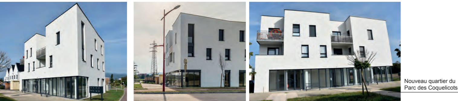
Nouveau quartier du Parc des Coquelicots

Une belle réussite pour des locaux sans "réserve"