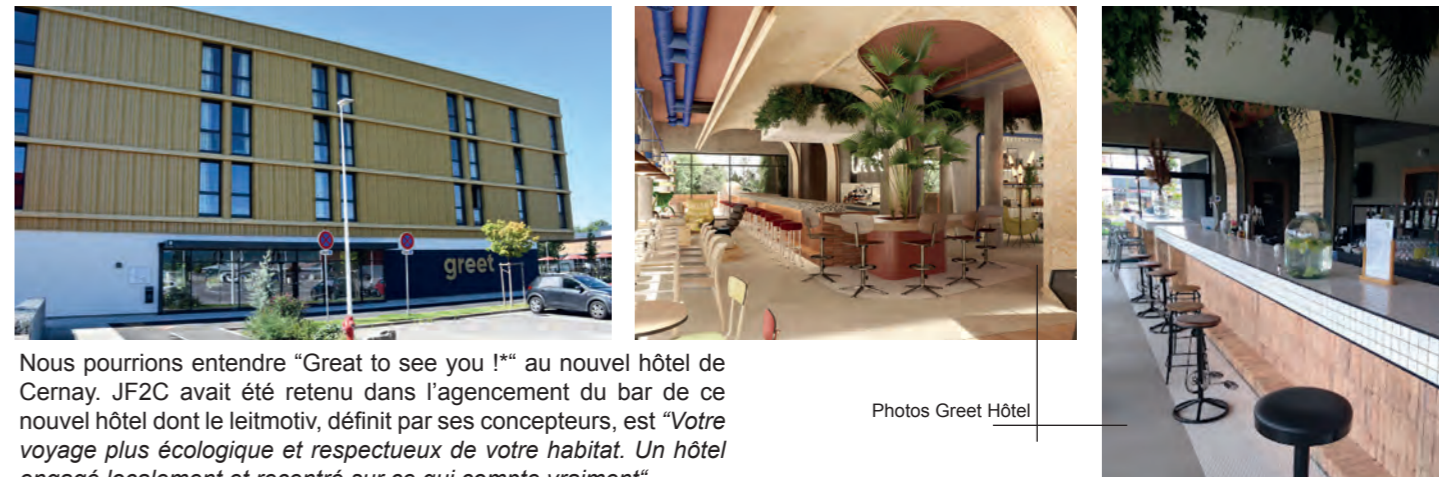
Photos Greet Hôtel

Nous pourrions entendre "Great to see you !*" au nouvel hôtel de Cernay. JF2C avait été retenu dans l'agencement du bar de ce nouvel hôtel dont le leitmotiv, défini par ses concepteurs, est "Votre voyage plus écologique et respectueux de votre habitat. Un hôtel engagé localement et recentré sur ce qui compte vraiment".